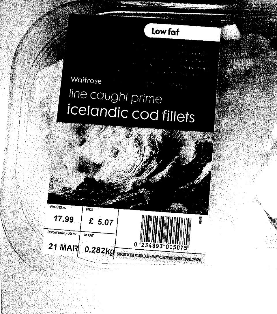
▲ TORSKEFILET FRA WAITROSE. Budskapet er «Low fat» og at torskens er fanget med line i islandske farvann. Ikke et ord om produktet er ferskt eller tint.

ved inspeksjon. Det billigste produktet var tint, og hadde ikke informasjon verken om fangstredskap eller fangstområde. Når det gjelder resten av produktene var det ingen konsekvente forskjeller i pris på produkter som hadde vært fryst eller som kunne ha vært fryst.